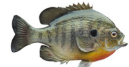
Pez sol/Mojarra de agallas azules (Bluegill)