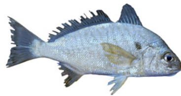
🍴 Croca (Spot)