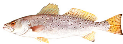
🍴 Trucha moteada/ pecosa (Speckled Trout)

Disfrute de un pescado más seguro consultando las advertencias locales y siguiendo las recomendaciones de raciones y comidas semanales.