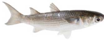
Mujil rayado (Striped Mullet)