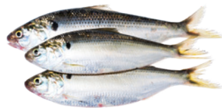
🍴 Sabalo (Shad)