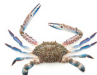
Cangrejo azul (Blue Crab)