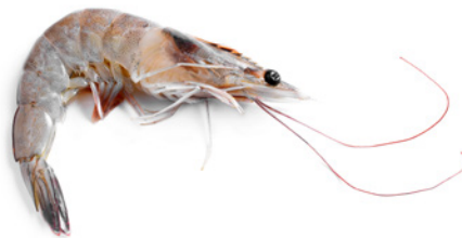
🍴 Camarones (Shrimp)